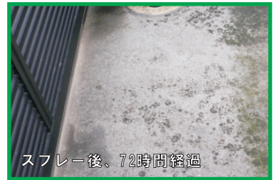
スプレー後、72時間経過